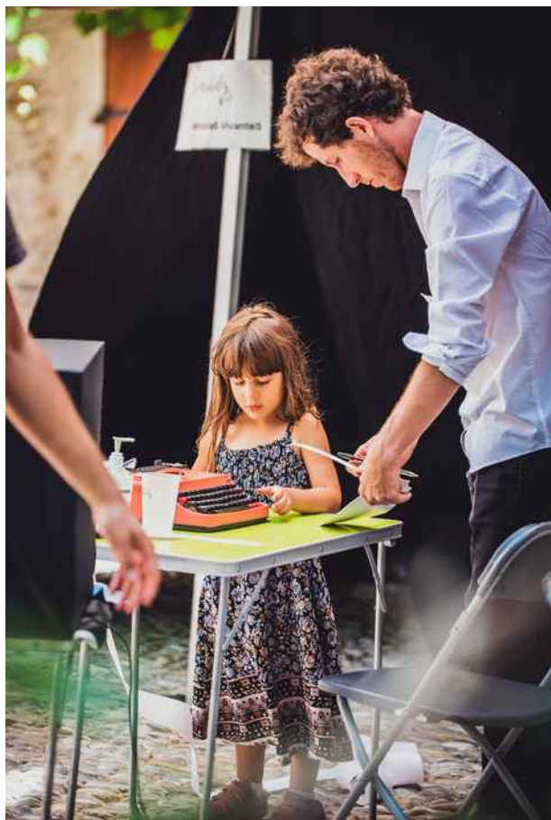
L'Addition Créative , Sensibilis 2021.