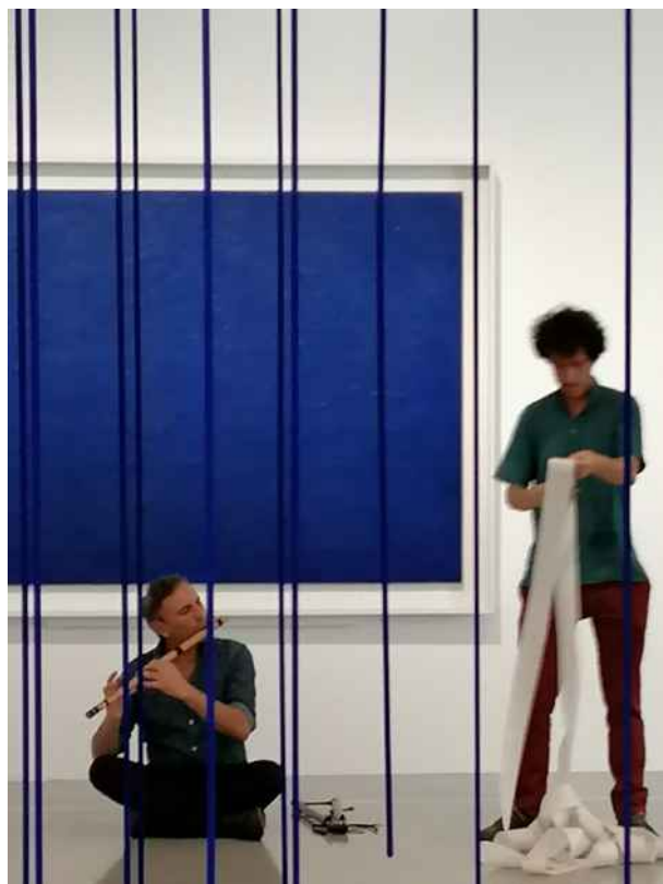
Musicircus , Mamac, Septembre 2021.