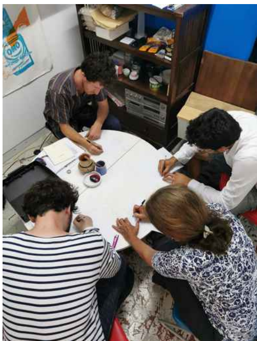
Atelier Poésie, Les Pépites, 2020.