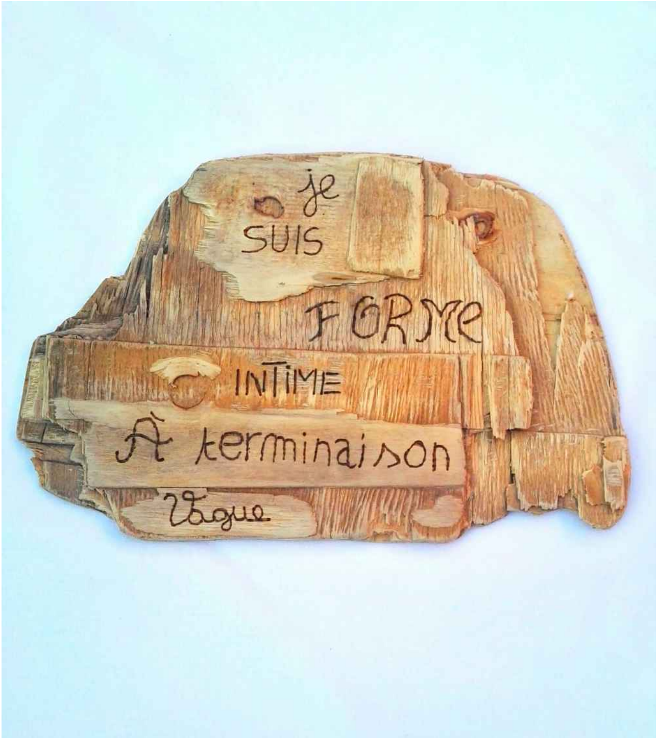
Portrait , bois pyrogravé, 2020.