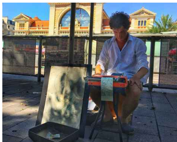
Poète Public au marché de la Libération à Nice